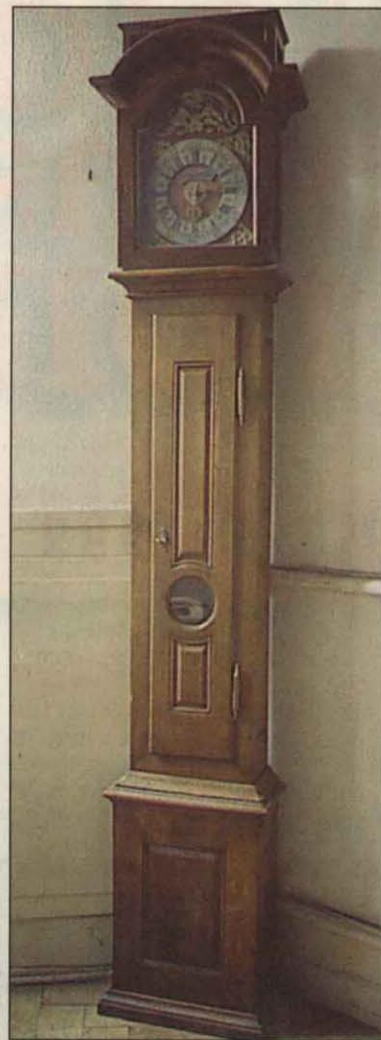
Eine von drei Standuhren von Möllinger im Fundus des Museums der Stadt Neustadt in der Villa Böhm. Verziert ist das Ziffernblatt mit allegorischen Figuren.

Nachfahren des Neustadter Uhrmachers haben sich bei Denzinger in Neustadt gemeldet und um Informationen